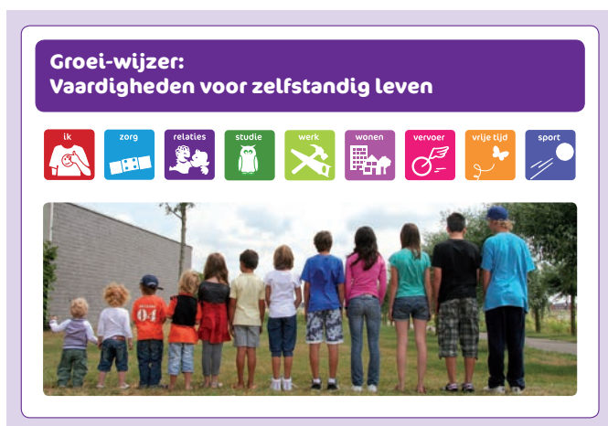
Figuur 1. De 9 domeinen van de Groei-wijzer.

epilepsie 3 ) en is er een Groei-wijzer voor kinderen en jongeren met een licht verstandelijke beperking (LVB). Er was bij start van het project nog geen digitale versie beschikbaar.